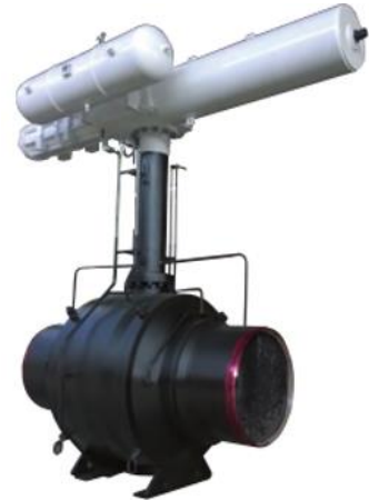
GAS OVER OIL & DIRECT GAS