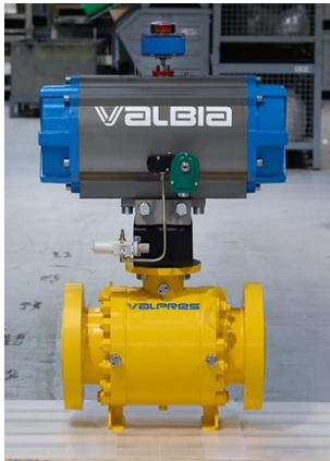
PNEUMATIC RACK & PINION