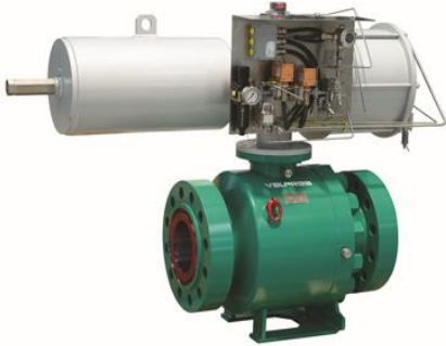
PNEUMATIC & HYDRAULIC SCOTCH YOKE

COMPLETE FREEDOM IN CHOICE OF ACTUATORS: PNEUMATIC (SCOTCH YOKE, RACK & PINION OR CRANK ARM ), ELECTRIC, HYDRAULIC (STANDARD, COMPACT), ELECTRO-HYDRAULIC, GAS OVER OIL, DIRECT GAS